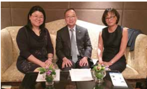
◆左起：世衛中國區肝炎高級顧問曾寶玲醫生、美國史丹福大學亞裔肝臟中心執行總監及香港乙肝基金會創會會長蘇啟深教授、世衛西太平洋區肝炎高級顧問盧穎如醫生。

蘇啟深教授稱，要確保不再有孩童受到乙肝病毒的侵害，政府和私人的資金要在此起到重要的作用。在過去的多年裡，亞裔肝臟中心與世界衛生組織、捐贈者以及中國和其他國家的疾控中心和衛生部合作，通過教育、宣傳、研究和推行衛生政策等多種途徑協助加強國家和省級衛生系統在肝炎預防、檢測和治療方面的綜合能力。