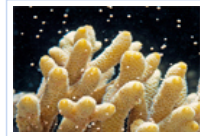
我和海洋有个约会