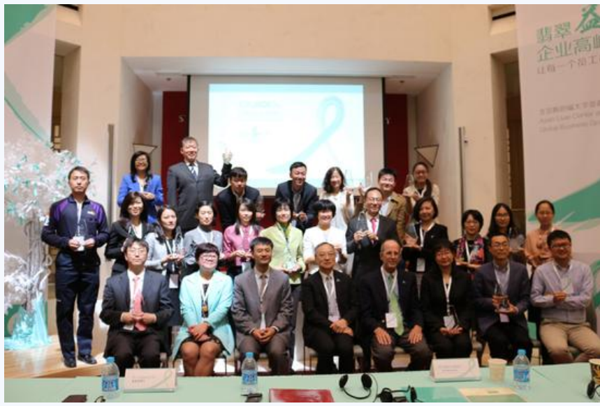
企业代表与嘉宾合影

上午, 近百名跨国企业代表、公共卫生界人士齐聚北京大学斯坦福中心, 参加由斯坦福亚裔肝脏中心和美国Global Business Group on Health (GBGH) 共同主办的首届“翡翠益起来”企业高峰论坛。本次论坛是一次里程碑事件, 标志着由两家主办单位及五家大型跨国企业发起的“中国翡翠丝带项目”(JoinJade for China) 进入了崭新的历史阶段。该项目是国内首个由社会组织与大型企业雇主共同主导的、致力于消除工作场所乙肝歧视的公益项目。