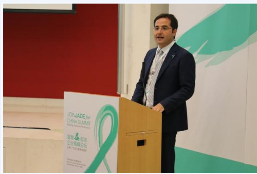
施南博士发表主题演讲

“企业界是中国最受关注、最能吸引人才和最具创新力的领域之一，如果广大企业能够携起手来，共同应对工作场所乙肝歧视问题，这无疑对推动整个中国社会提升对乙肝的认识、消除对乙肝歧视具有积极的意义。”苏启深教授说，“‘中国翡翠丝带项目’最初由斯坦福大学裔肝脏中心、GBGH与包括IBM、通用电气、英特尔、惠普企业和惠普公司在内的五家企业于去年7月发起，不到一年时间已吸引了另外24家企业参与。相信在此次论坛之后，将有更多的企业，特别是中国本土企业加入我们，让更多的员工得享零乙肝歧视的工作环境。”