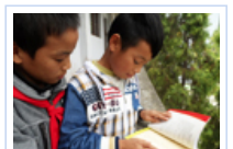
扬帆计划-我要读书